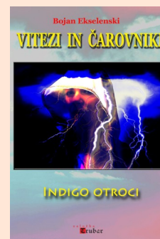
Naslovnica Indigo otrok