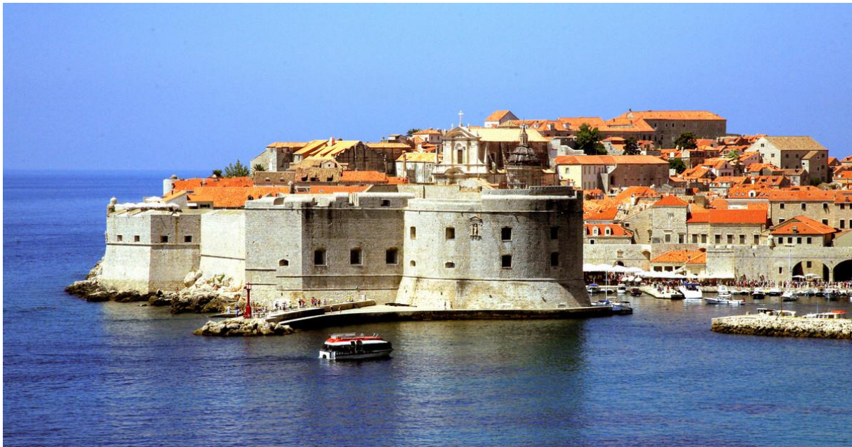
Dubrovnik – panorama, obzidje ob pristanišču

Senat, ki se je sprva imenoval »svet naprošenih« po beneškem zgledu, je bil glavni politični organ Dubrovniške republike. V začetku so ga sestavljali samo ugledni aristokrati, ki jih je najvišji svet vpraševal za mnenje. Pozneje so sestavljali besedilo zakonov, ki jih je svet samo formalno odobril. V šestnajstem stoletju so naprošeni postali senatorji in prevzeli praktično vso oblast. Senatorji so bili sprva imenovani za eno leto in so bili lahko spet imenovani po preteku dveh let. Pravilo o preteku dveh let je bilo kmalu ukinjeno in vsako leto so se volili vedno kar isti senatorji. Prav s tem je nastala aristokratska republika, ki je bila – podobno kot v Benetkah – najbolj uspešna ureditev države v celotnem obdobju njenega obstoja.