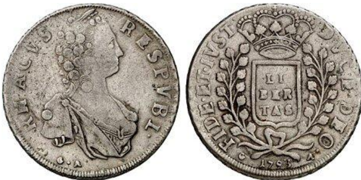
Prednja in zadnja stran dubrovniškega kovanca imenovanega »libertina«.

Libertina je bil med vsemi najbolje izdelan dubrovniški denar. Kovan je bil iz boljšega srebra in je tako imel tudi večjo vrednost. V drugi polovici 16. stoletja je sredozemska pomorska mesta zajela gospodarska kriza, ki ni prizanesla niti Dubrovniku. To je prisililo Dubrovnik v uporabo različnih ukrepov za uspešno sanacijo svojega monetarnega sistema. Večino tega uspeha je temeljilo prav na libertini.