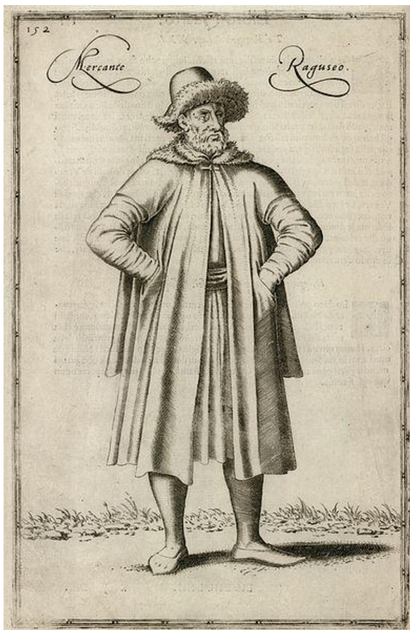
Lesorez Mercante Raguseo (dubrovniški trgovec); Nicolas de Nicolay (1517-1583), francoski geograf in raziskovalec.

V 15. stoletju so pomorsko trgovsko dejavnost opravljali v glavnem v Sredozemlju, na Balkanskem polotoku in v srednji Evropi. Pomorska trgovina z turškimi deželami je bila močna vse do prve polovice 17. stoletja. Potem so trgovali tudi z zahodno obalo Atlantika. Prva omemba dubrovniških trgovskih zvez z Anglijo, je iz leta 1443, ko sta bila tam dva dubrovniška trgovca. Vendar nihče ne ve, kako sta tja prišla. V začetku 16. stoletja so dubrovniške ladje že redno zahajale v Atlantik. Najdemo jih v Lizboni, Southamptonu in Londonu. V Londonu se je kmalu zatem ustalila dubrovniška kolonija, ki jo tvorijo predstavniki plemstva. Iz Anglije so v Dubrovnik in naprej v Turčijo vozili tkanine. Nazaj so vozili vino s Krete.