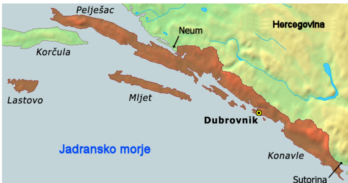
Zemljevid Dubrovniške republike, njen največji obseg.

Gospodarska in politična ureditev ji je omogočila ozemeljsko širitev. Tako je leta 1333 kupila od srbskega carja Dušana mesto Ston in polotok Pelješac. Car Uroš pa ji je odstopil ozemlje ob srbsko-dubrovniški meji, od Ljute v Župi do Petrovega sela na zahodu. Sredi 14. stoletja je Dubrovnik utrdil svojo oblast nad Mljetom. Bosanski kralj Ostoja mu je prodal obrežni del od kraja Orošac do Stona. V 15. stoletju pa si je pridobil še Konavle. S pridobitvijo oblasti nad vsemi temi pokrajinami je Dubrovnik dejansko postal neodvisen ter se je spremenil v mestno državo. Od srede 15. stoletja je Communitas Ragusina uradno postala Respublica Ragusina . Oblast so imeli v rokah domači plemiči, imenovani vlastelini.