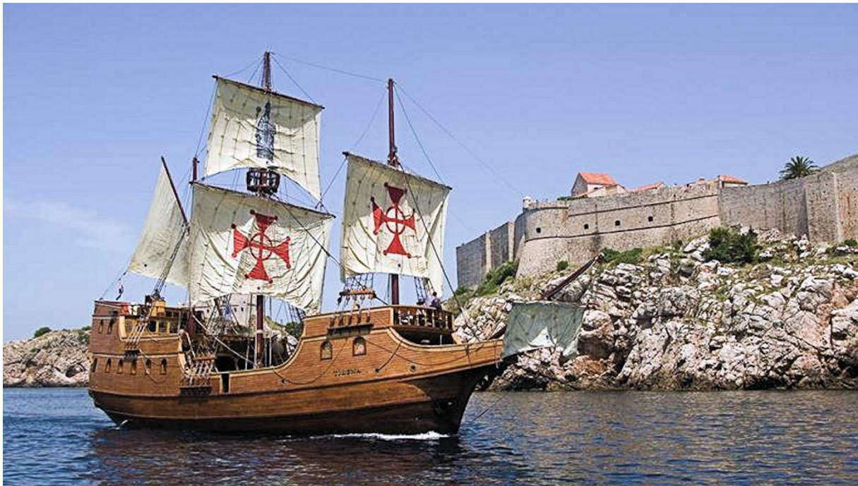
Replika dubrovniške karake pred obzidjem Dubrovnika.