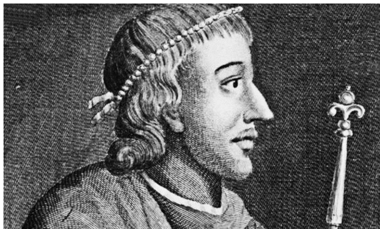
Knut Veliki (995-1035), izsek iz stare zgodnje-srednjeveške grafike

»Naj vsi slišijo kako slaba in brez vrednosti je tako opevana moč kraljev! Njihova moč ni omembe vredna. Moč pripada le Njemu, ki kroji zakone nebesom, zemlji in morju.« ( citata: Henry of Huntingdon /zgodovinar, 1088–1157/ ). Potem bi naj obesil svojo zlato krono na križ in si je nikoli več ni posadil nazaj na glavo, s pojasnilom, da »tako izkazuje spoštovanje Bogu, ki je kralj vsega.«