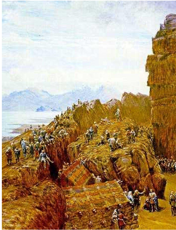
W.G. Collingwood - Althing se je zbral (19. stoletje)

Althing (dobesedno »zbor, srečanje vseh«) je takoj postal narodno zborovanje, kje so se enkrat letno zbrali prebivalci vse Islandije. Bil je politično in sodno zborovanje in tudi družabni dogodek. Do začetka 11. stoletja se je letno odvijal v desetem tednu poletja, kasneje so za otvoritveni dan določili četrtek v 11. tednu poletja (18.-24. junij).