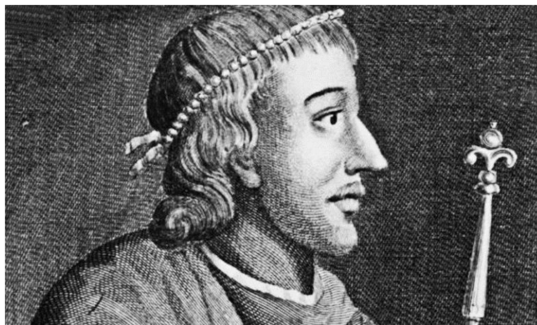
Knut Veliki (995-1035), izsek iz stare zgodnje-srednjeveške grafike

»Naj vsi slišijo kako slaba in brez vrednosti je tako opevana moč kraljev! Njihova moč ni omembe vredna. Moč pripada le Njemu, ki kroji zakone nebesom, zemlji in morju.« (citata: Henry of Huntingdon /zgodovinar, 1088–1157/ ). Potem bi naj obesil svojo zlato krono na križ in si je nikoli več ni posadil nazaj na glavo, s pojasnilom, da »tako izkazuje spoštovanje Bogu, ki je kralj vsega.«