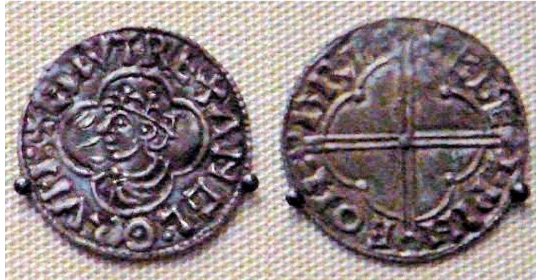
Kovanec Knuta Velikega – osnova prve evropske monetarne unije

Praktičnost njegovih kovancev in pripadajoče zakonodaje so spoznali tudi v vazalnih deželah in se priključili prvi evropski monetarni uniji. Tako so z isto valuto plačevali na Norveškem, na Danskem, v Skaniji (južna Švedska), v Angliji, v Roslandiji (vzhodna Švedska), na Škotskem, v Welsu, v Normandiji (del Francije) in na Poljskem ter na nekaterih delih vzhodne Irske.