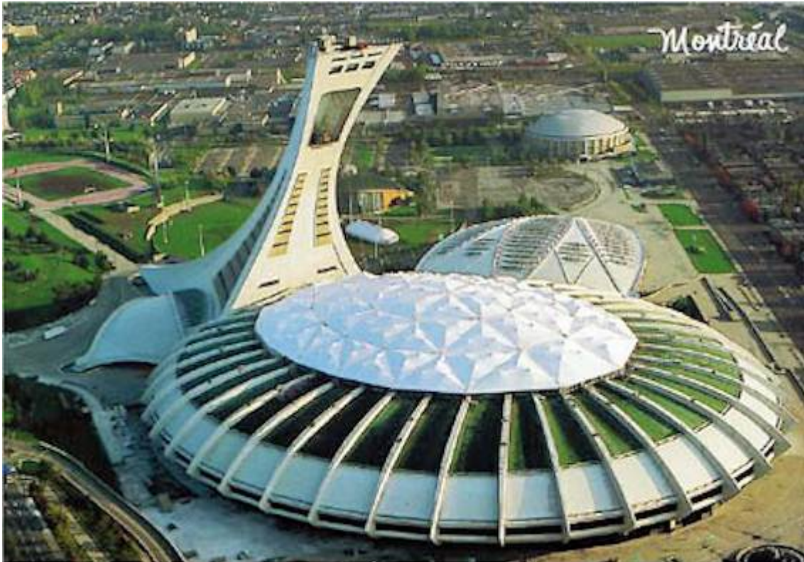
Slika 2 – Olimpijski stadion v Montrealu 1976, ki je stal 2,5 milijarde USD in so ga odplačevali do leta 2006.

Njegova izgradnja je draga, vendar pa skoraj zagotovo prinese denar, čast in slavo prireditelju. Razen v Montrealu 1976. Njihov glavni stadion jih je stal 2,5 milijarde ameriških dolarjev in pridelal izgubo 1,5 milijarde, ki so jo odplačevali še trideset let vse do leta 2006!