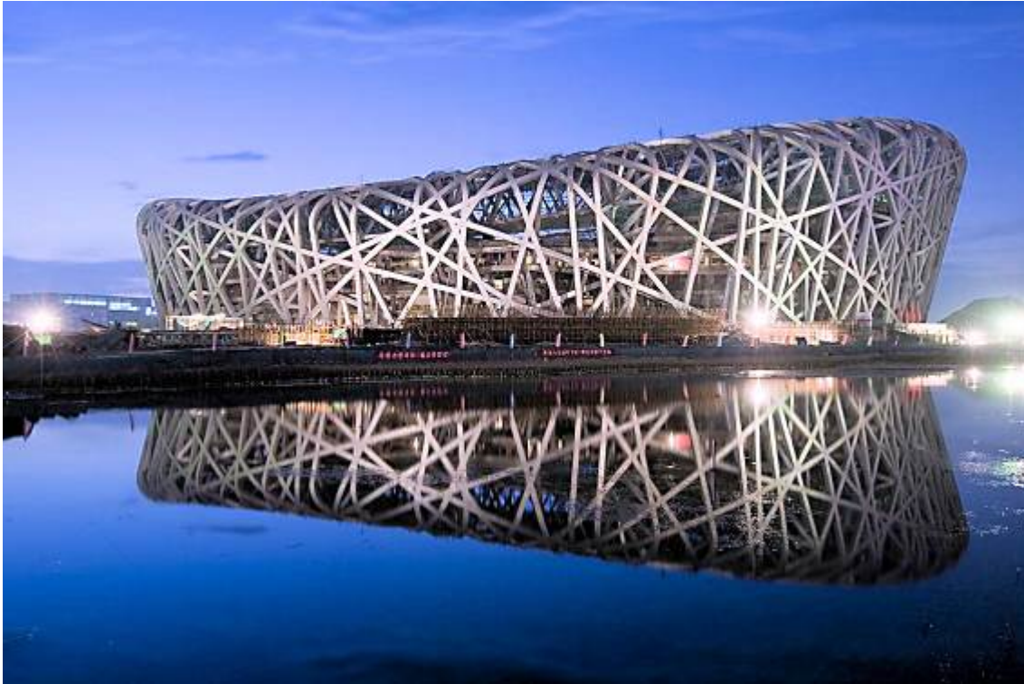
Slika 4 – Neverjetno zahtevna gradnja, za katero so porabili neznano količino dolarjev – »ptičje gnezdo« za olimpijske igre Peking 2008.

prodajati še dražje. Tako si jih majhni kabelski operaterji in ponudniki interneta niso več mogli privoščiti. Urnik tekmovanj so prilagodili tako, da so sovpadali s »prime time« na TV postajah v ZDA. Ti ukrepi so prinesli prave rezultate in dvig števila gledalcev na prejšnji nivo šele ob igrah v Pekingu 2008.