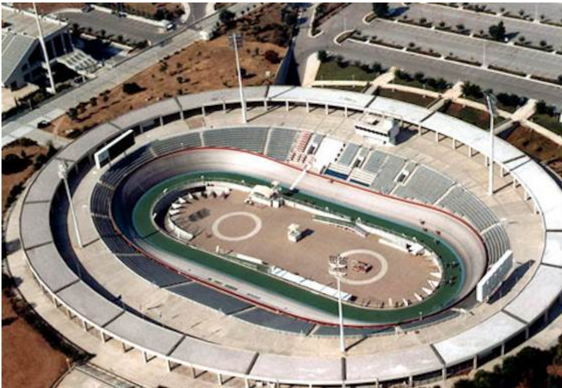
Slika 3 – Atenski velodrom ob izgradnji.

Potem so bili na vrsti Grki in igre v Atenah 2004. Prav vehementno so se zagnali v izdelavo olimpijskih prizorišč in so jih praktično skoraj vse zgradili na novo. Porabili so 15 milijard USD in ustvarili izgubo v višini 6 milijard! Ali je tukaj začetek sedanjih finančnih težav Grčije? Zagotovo, saj še vedno plačujejo tudi te kredite poleg vseh ostalih. Dva objekta, velodrom in softball stadion, sta bila uporabljena samo na igrah. Od takrat se v njiju ni odvil niti en dogodek! Zdaj žalostno propadata, saj ju nihče ne vzdržuje.