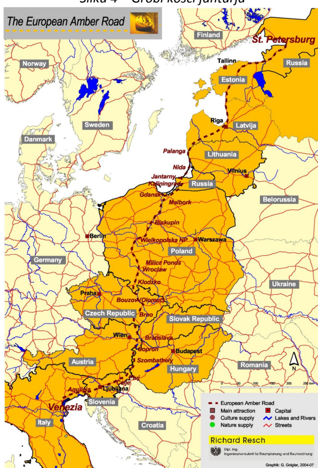
Slika 5 – Jantarna pot čez Evropo