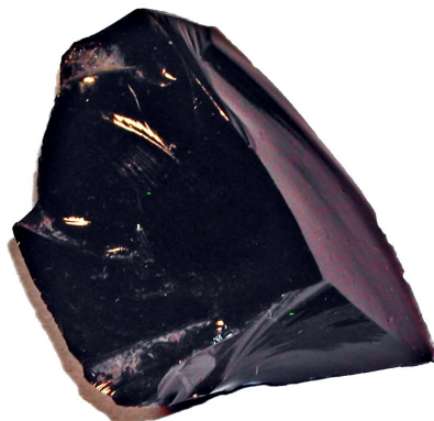
Slika 2 – Tipični primerek obsidiana, vulkanskega stekla nastalega iz kremenca

in pestnjak – nož tudi zelo lahek. Torej je bil za kamenodobnega človeka to luksuzni izdelek največje vrednosti. V naravi najdemo ob črnih primerkih še zelene, rjave, brezbarvne in bele, kar nastane zaradi različnih kovinskih primesi. V nekaterih najdemo neenakomerno razporejene kristale kristobalita, ki so na črni podlagi videti kakor snežinke. Včasih se ujamejo vanj plinski mehurčki in mu lahko dajo zlati sijaj. V kamni dobi so poleg rezil iz njega izdelovali še osti za puščice in kopja ter ga gladili v prva preprosta zrcala! Izdelki iz obsidiana so bili zgodnje kamenodobni luksuzni predmeti in z njimi je bil precej velik promet. Pri arheoloških izkopavanjih so našli mnogo primerkov predvsem na Bližnjem vzhodu in po vsem Sredozemlju. Od tukaj so se širili čez celinsko Evropo do Baltika in še naprej.