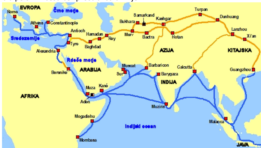
Slika 3 – Potek svilne ceste po kopnem in po morju

Tako kot danes, je bila nekoč Kitajska svetovna proizvodna in trgovska velesila. Rumena reka je srce Kitajske civilizacije in je omogočala obsežno poljedelsko aktivnost ter proizvodnjo viškov. Prvi trgovski izdelki so bili riž, morske školjke za okrasje, želvjvi oklepi za izdelavo luksuznih izdelkov, žad in kositer. To so vozili tudi na Malajski polotok in v osrednjo Azijo. Ko se je v Evropi pojavil Rimski imperij, so pričeli izvažati svilo, ki je potovala po svilni cesti čez prostranstva Azije.