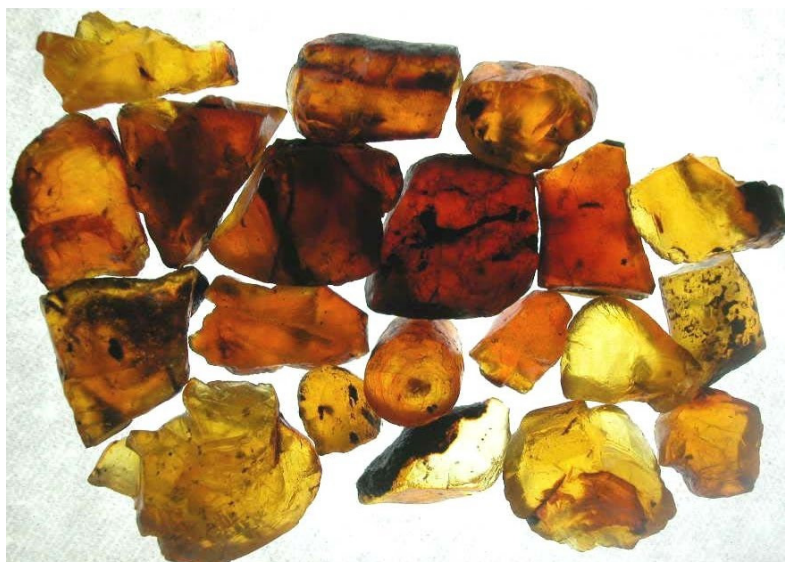
Slika 4 – Grobi kosci jantarja