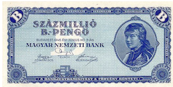
Slika 8 – Bankovec z najvišjo zapisano vrednostjo na svetu: 100.000.000.000.000.000.000 (100 milijard milijard ali 10^{20} ) pengö

Že sam bankovec izdan 1946 z najvišjo vrednostjo je svetovni rekorder. Na njem je Madžarska nacionalna banka natisnila vrednost 100.000.000.000.000.000.000 (100 milijard milijard ali 10^{20} ) pengö. V načrtu je bil tudi takšen z vrednostjo 10^{21} , a ga niso dali v obtok. Na njem niso napisali številko z ničlami, ampak so jo zapisali opisno »szazmillio b.-pengö« ali »stomilijonov b-ilijard pengö«. Tako je na zimbabvejskem bankovcu napisanih največ ničel.