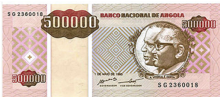
Slika 3 – Angolski bankovec za 500.000 kwanza AON iz leta 1994. Danes je vreden le še 0,00005 kwanza AOA.

V sedemdesetih letih dvajsetega stoletja je v težave zapadla večina držav Južne Amerike. Največje gospodarstvo je Brazilija, ki je trpela hiper-inflacijo v letih od 1967 do 1994. Najvišja je bila leta 1994 in je znašala 2.075,80 %. Takrat so uvedli novo valuto real in povzeli druge ukrepe, da so zaustavili spiralo dvigovanja cen. Soseba Argentina je bila v težavah od leta 1975 do 1991. Najvišji bankovec iz leta 1975 je veljal 1.000 pesos. Do konca leta 1981 je imel na sebi napis 1.000.000 pesos. Leta 1985 so uvedli denominacijo 1 austral = 1.000 pesos in leta 1992 so vajo ponovili: 1 peso = 10.000 australes. Končni rezultat: 1 peso(1992) = 100.000.000.000 pesos(1975). Bolivija je bila v hiper-inflacijskih časih v letih od 1984 do 1986. V tem času je vrednost najvišjega bankovca dosegla menjalno sorazmerje 1 boliviano = 1.000.000 pesov.