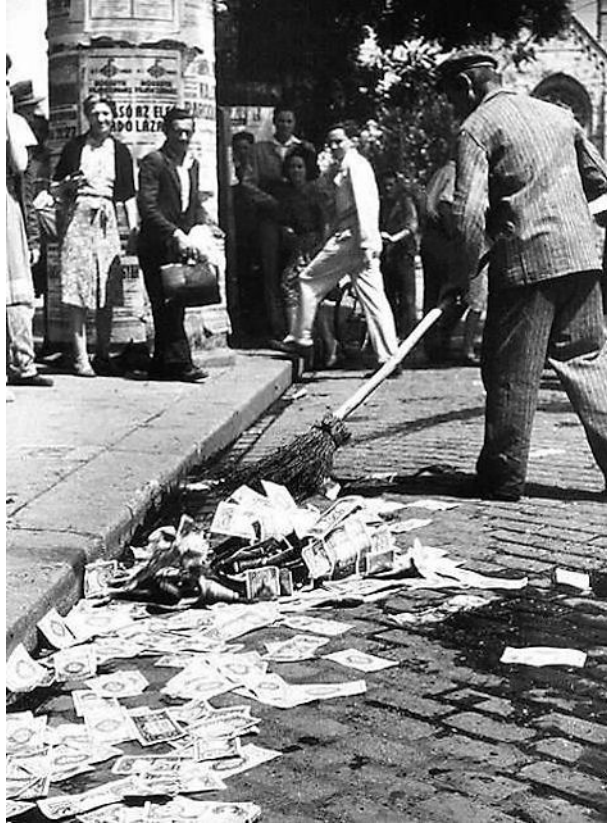
Slika 9 – Denarja kot listja in trave ter enako brez vrednosti. Madžarska avgusta 1946 po zamenjavi ničvrednega denarja pengő za forinte.

Stare pengő so ljudje množično odmetavali na tla. Cestni pometači so jih kot jesensko listje pometli, naložili v svoje vozičke in odpeljali na smetišče.