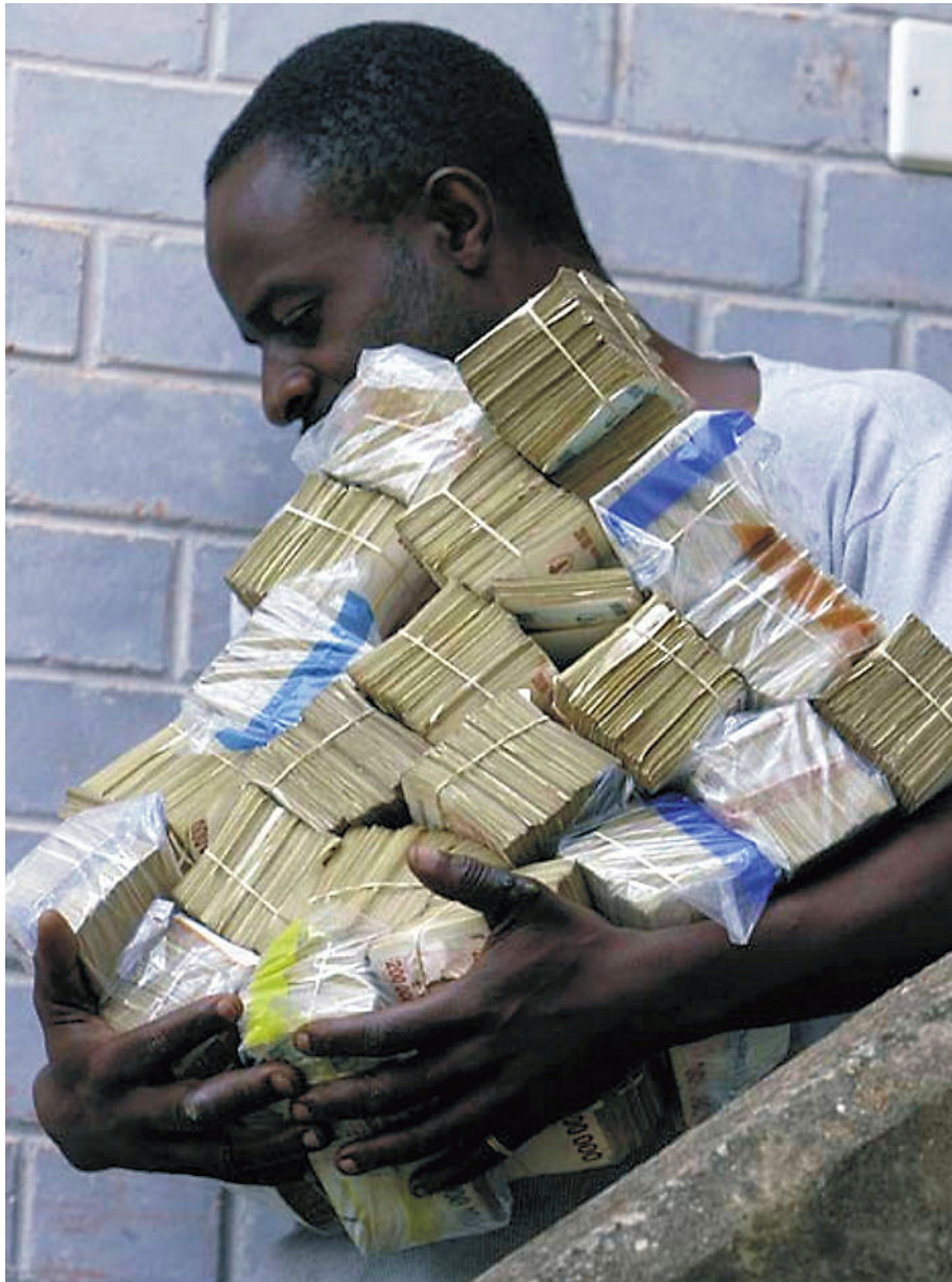
Slika 4 – Za vsakodnevni nakup v Angoli je še danes potrebno prinesiti neverjetno količino bankovcev. Angola je sedma na večni lestvici hiper-inflacije in najbolj obeta, da v letu ali dveh prevzame primat.

Preden se lotimo »finalistov, na hitro preglejmo še nekaj »grešnikov«: