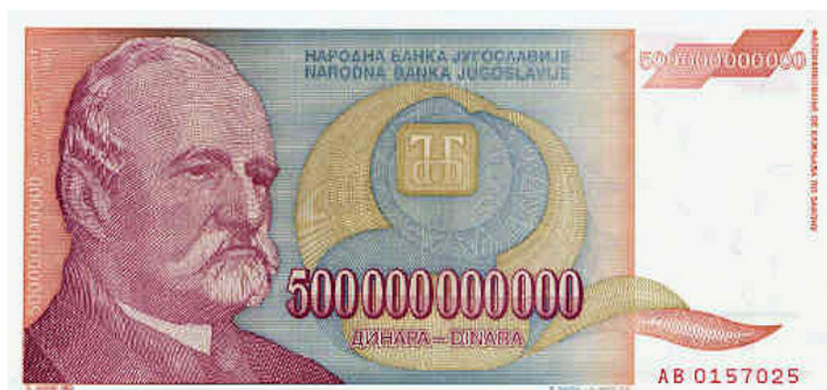
Slika 6 – Januarski dinar (januar 1994) za 500 milijard (Zvezna republika Jugoslavija). Njegova vrednost je bila okrog 0,000026 nemške marke ali 0,002 slovenskega tolarja.

Območje bivše države je še naprej ostalo sredi vojne vihre in zato so jo vse države vključene v spopade financirale s tiskanjem denarja. Dinar je doživel tretjo denominacijo prvega julija 1992 v razmerju 1 YUR (reformirani dinar) = 10 YUN. A kaj dosti ni pomagalo, saj so samo brisali ničle z bankovcev, prave gospodarske reforme se niso lotili.