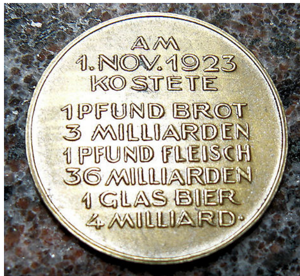
Slika 1 – Spominska medalja na nemško hiper-inflacijo. Napis na medalji: Prvega novembra 1923 je stal 1 funt (1 funt = 0,45359 kg) kruha 3 milijarde, 1 funt mesa 36 milijard in 1 kozarec piva 4 milijarde.

Na primer, zelo znana je nemška hiper-inflacija iz leta 1923. Danes v njen spomin kujejo celo posebne spominske medalje. Bila je zelo, zelo visoka. Toda ..., še vedno ne najvišja.