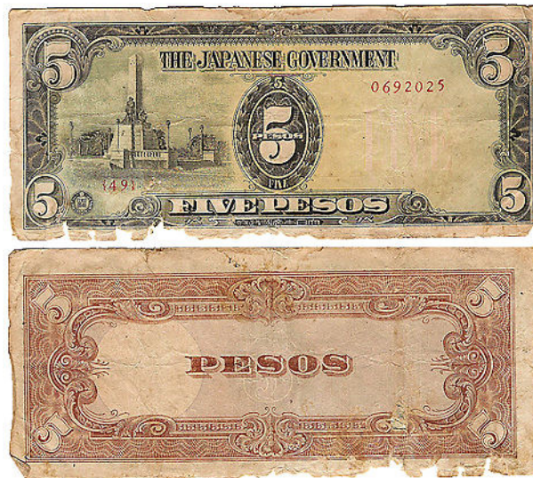
Slika 2 – Denar imenovan »Miki Miška« je izdala marionetna vlada Filipinov pod japonsko okupacijo v drugi svetovni vojni.

Na tem mestu bi moral omeniti hiper-inflacijo v cesarski Nemčiji leta 1923, vendar jo bom opisal v nadaljevanju. Sodi namreč med šest največjih na svetu in si zasluži posebno obravnavo.