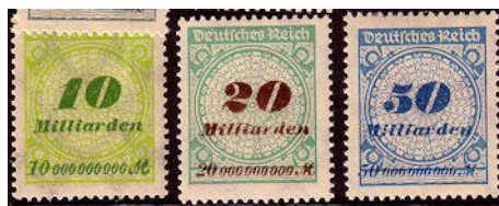
Slika 5 – Nemške hiper-inflacijske znamke. Pismo v domačem prometu je bilo potrebno frankirati z vsaj 10 milijardami mark!

Med ljudmi je najbolj znana hiperinflacija iz časov gospodarske krize pred drugo svetovno vojno, imenovana hiperinflacija Weimarske republike. Morda je najbolj znana, ker je na oblast pripeljala Adolfa Hitlerja in ker so prvič zaokrožile fotografije kupov brezvrednega denarja, ki so jih ljudje nosili v trgovino, da kupijo kilogram kruha.