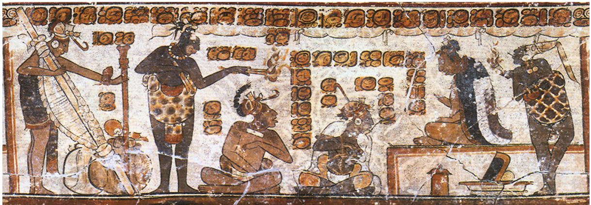
Plačilo davkov majevskemu vladarju. Na robovih so zapisi, ki označujejo vrsto plačila in količine (Reents-Budet, keramična vaza).

Ob običajni blagovni menjavi so poznali menjavo s pomočjo menjalnih sredstev, na primer kakavova zrna, zlato, bakrene jagode, žad in školjčne lupine. Ponarejanje je bilo zelo razširjeno, saj so namesto žada podtikali druge podobne, a manj dragocene kamne. Podobno je bilo pri zlatu. Goljufali so še pri tehtanju in merjenju tekočin. Vse to je zapisano na nekaterih kamnitih ploščah. Te izdajajo, da so poznali sodnike, ki so jim rekli b'atab . Ti so na tržnici razsojali o goljufijah in določali povračila.