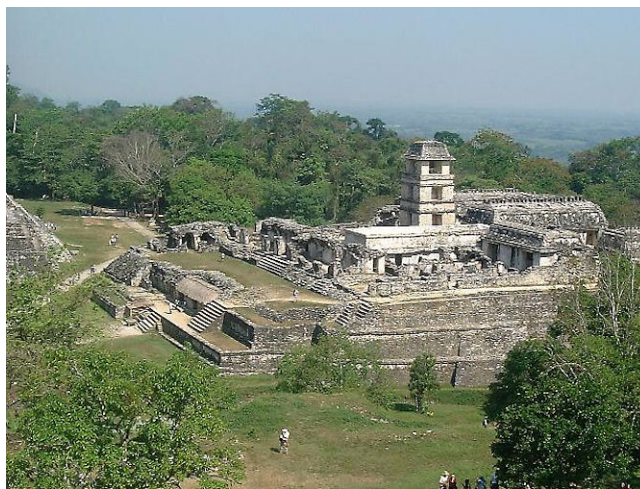
Ruševina piramidnega svetišča v mestu Palenque.

Priče so morale zapriseči pred lokalnim božanstvom. Obstajale so tudi osebe, ki so opravljale funkcijo odvetnikov, oziroma pravnih svetovalcev. Višino in način kazni je določal b'atab , se je pa kazen lahko znižala, če je žrtev javno izjavila, da sprejema obtoženčevo opravičilo. Če sta bila udeleženca v procesu iz dveh različnih mest, so se najprej dogovorili, kateri b'atab bo izvedel sojenje. B'atabi so se predvsem pri zahtevnih procesih oprli tudi na mnenja veljakov, ki niso bili neposredno zapleteni v primer.